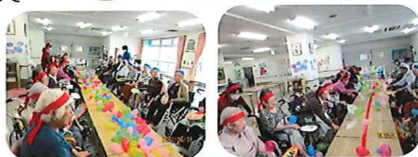
うちわで風船ラリー