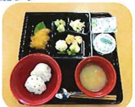
《6月 行事食メニュー》