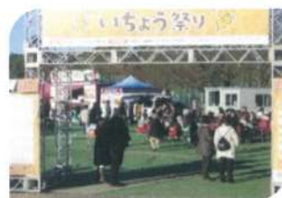
目移りするグルメ屋台

この神宮外苑いちちょう並木は、青山通りから約300m続く146本のいちちょうからできており、黄金色のトンネルとなった並木道は東京の紅葉スポットとして有名です。外国の方も紅葉したいちょう目当てにこの場所に来るそうです。そこではいい写真を撮るいい角度で撮りたいため、道路に出てしまったり、立ち入り禁止の場所で撮影したり、枝を揺らし紅葉した葉をわざと落としたりと、目に余る行動が多いようです。美しい紅葉を多くの人に見てもらおうと、自分勝手な行動をとるのではなく、ルールを守った見物、写真撮影を心がけ『もみじがり』を楽しみましょう。