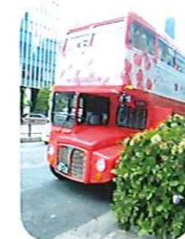
2階建てロンドンバス

コロナ感染症が5類に引き下げになり、外出が緩和されたので、とある休日に久しぶりに外へ出て、銀座観音山フルーツパーラーが主催するアフタヌーンティーバスに参加しました。2階建てのロンドンバスで東京都心部を90分間クルージングバスしながらアフタヌーンティーを楽しむ企画です。バスの内装は華やかな黄色とオレンジを基調とした「フルーツガーデン」をイメージしていました。道順は、銀座を出発し東京タワー近く・表参道・渋谷・霞が関・皇居周辺・最終的に元の銀座に戻るパターンです。バスの2階からいつもと違う風景を眺めながら、美味しいものを食べ、東京で90分間の非日常体験をしてきました。久しぶりの外出は楽しかったのと季節によってアフタヌーンティーの果物が変わるのでまた行ってみたいと思います。