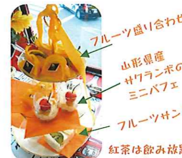
フルーツ盛り合わせ