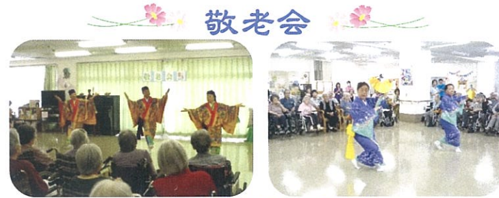
「東陽こづち会」のみなさん

まだまだ厳しい残暑が続く9月14日(土)に、四季の里2階フロアにて日本舞踊を鑑賞しながら長寿のお祝いをしました。 利用者様で古希の70歳、喜寿の77歳、傘寿の80歳、米寿の88歳、卒寿の90歳、白寿99歳の方のお名前が発表されました。みなさん手を振られたり、ニコニコされたりとお祝いは嬉しいものですね！今回は「東陽こづち会」の皆さんによる日本舞踊の踊りを披露してもらいました。それぞれのふるさとの曲が懐かしく口ずさんでる方もいらっしゃいました。 踊りも衣裳もステキでしたね！とてもすばらしい敬老会となりました。