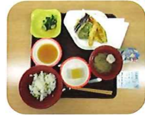
《8月 行事食メニュー》

8月行事の「納涼会」は、フロア毎に盆踊りを行いました。法被と浴衣を着た職員が“東京音頭”と“炭坑節”を踊り、入所者様には感染防止の為、各自の席で参加して頂きました。「もう踊れないと思ったけど、手は自然に動くね」と職員の踊る姿に合わせ、身振り手振りで体を動かしていました。「子供の頃踊ったわ」「懐かしいね」と昔の事も思い出しながら、短い時間でしたがお祭りの雰囲気を楽しんで頂けたようです。